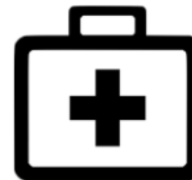
Permiso por razones médicas